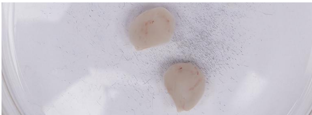
图 3 翻转左右大脑