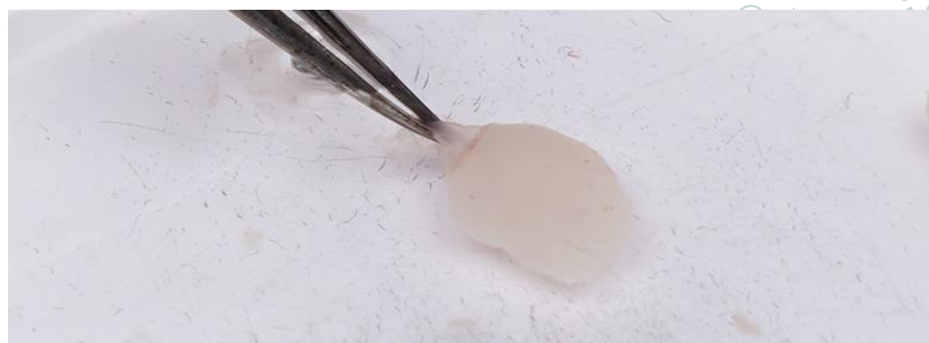
图7、左手辅助固定脑组织，右手使用解剖镊撕下脑膜