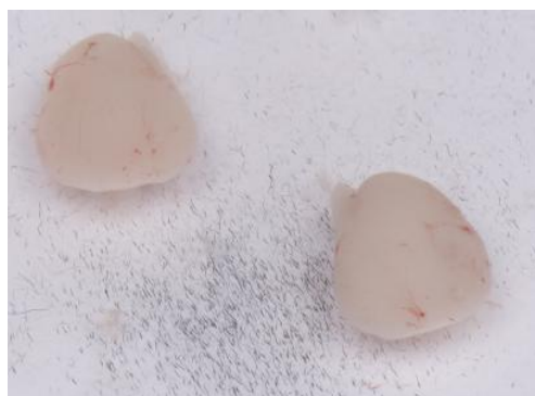
图5、再次翻转左右大脑，皮层面朝上