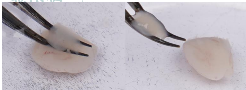
图 4 分离实质，留取大脑皮层