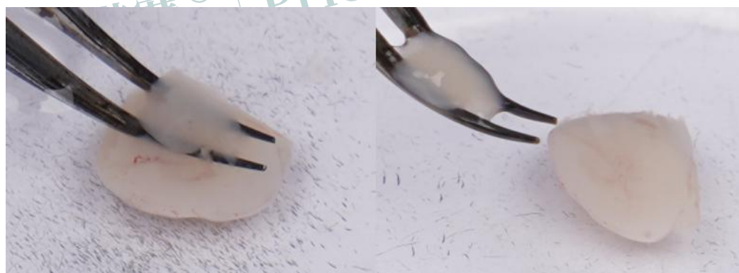
图 4 分离实质，留取大脑皮层